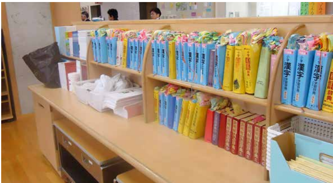
لغت نامه‌هایی که آقای فوکویا در ژاپن با بچه‌ها کار کرده است