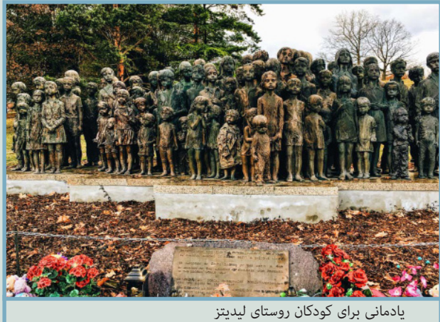
یادمانی برای کودکان روستای لیدیتز

لیدیتز Lidice، روستای واقع در منطقه کلادنو Kladno جمهوری چک، ۲۲ کیلومتری شمال غربی پراگ است. این روستا در ژوئن ۱۹۴۲ با دستور آدولف هیتلر جهت انتقام از ترور یکی از اشخاص بالا مقام حکومت نازی به‌طور کامل تخریب شد. بعد از پایان جنگ، یک روستای جدید روبروی روستای اصلی که با استفاده از پولی که توسط کمپین «لیدیتز همیشه زنده است» و در شمال استافوردشایر در انگلیس مستقر بود، ساخته شد. فقط ۱۵۳ زن و ۱۷ کودک به آن روستا بازگشتند و در آن ساکن شدند. بخش اول روستای جدید در سال ۱۹۴۹ تکمیل شد.